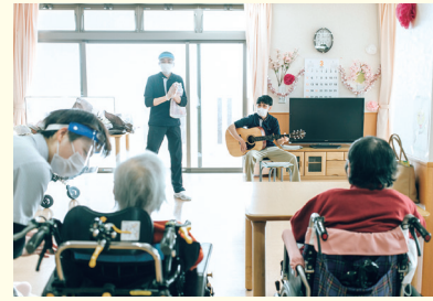
明るい施設で仕事をしています

足羽福祉会は福祉のお仕事をしています。「子ども福祉」「障がい者福祉」「高齢者福祉」の分野で、30以上の施設を運営。赤ちゃんからお年寄りまで、みんなが幸せに暮らせる地域社会を目指しています。また、福祉を身近に感じてもらえるような取り組みも行っています。