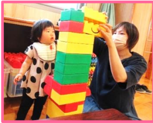
大型レゴブロック 高く積めたね