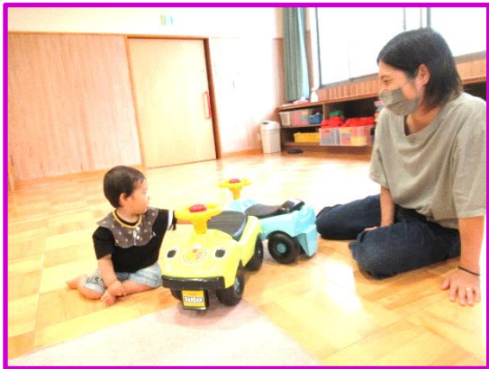
ブーブー どれに乗ろうかなあ