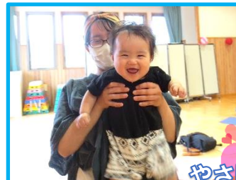
やさしく触れて 気持ちいい～