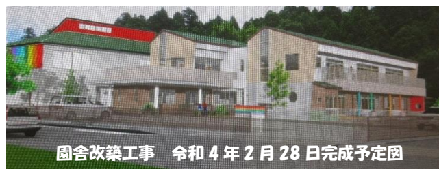
園舎改築工事 令和4年2月28日完成予定