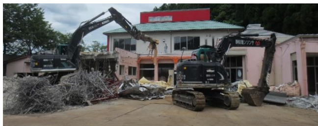
旧園舎解体工事(6.7月)

園解体工事が終了し、また、保護者会会長様にもご参列 頂き、地鎮祭が執り行われました。新園舎の完成に期待 を寄せ安全に工事が進むよう、子ども達や保護者の皆様 と共に見守っていききたいと思います。