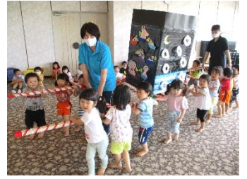
たんぽぽ組おみこし