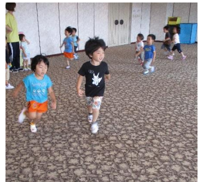
大広間でかけっこ「思いっきり走れるよ」