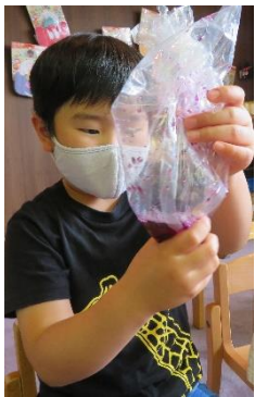
あさがおで色水作り「いろいろな色を発見」