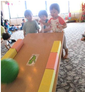
ボールボーリング