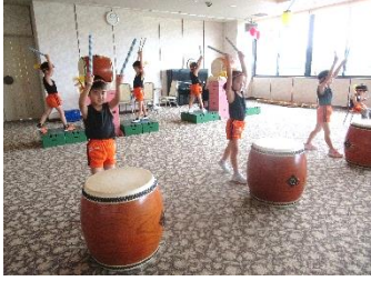
ひまわり組太鼓発表