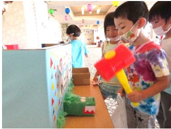
わにわにパニック