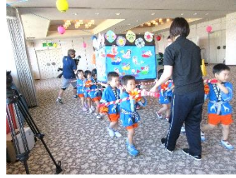
さくら組おみこし