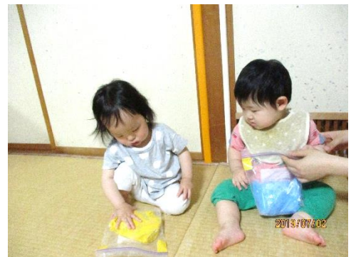
水に触って見たよ「冷たいな」