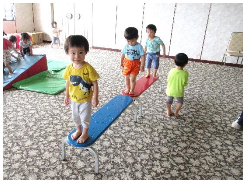
一本橋渡り「バランス取れるようになったよ」