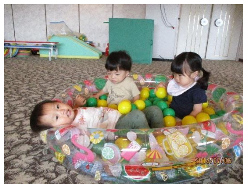
フルーツボール遊び「ボールの中気持ちいい」