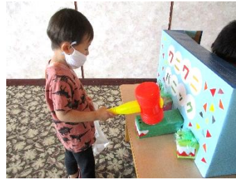
わにわにパニック