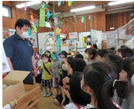
もぎたて館に笹飾りを飾ってもらったよ