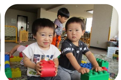
大型レゴブロック ひまわり