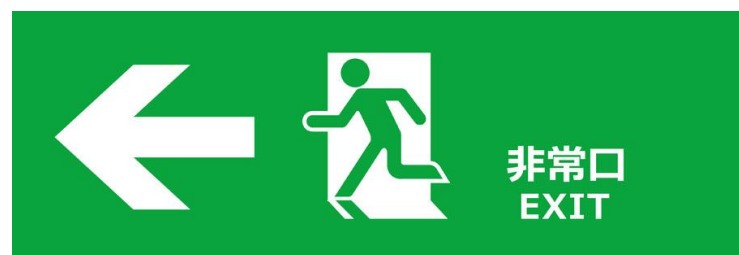
職員も消火訓練を行いました。