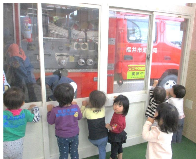
消防車が到着してワクワク(1歳児)