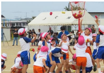
上文殊小学校運動会(5歳児)