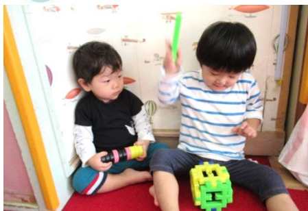
太鼓遊び(ブロックで自分で作ったよ)