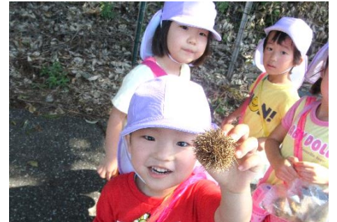
栗拾い(イガイガ痛くないよ)