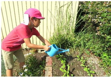
大根の苗植え(水を沢山飲んで大きくなあれ)