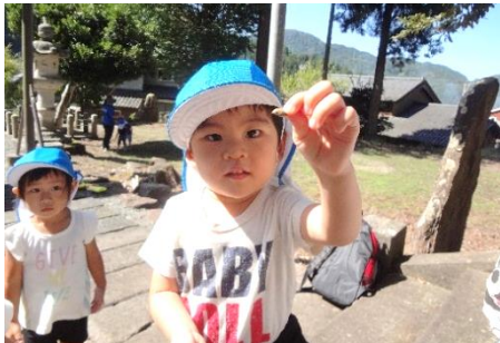
虫探し(これなんて名前?)