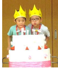
協力してキャンドルの火を消そう