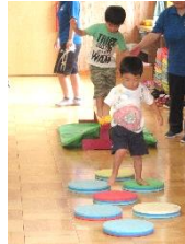
虫を探しにお出かけ