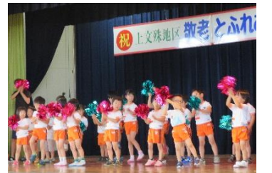
上文殊敬老の集い(3, 4, 5歳)