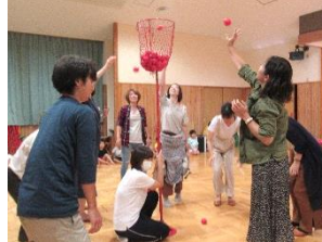
誕生児と保護者で競争