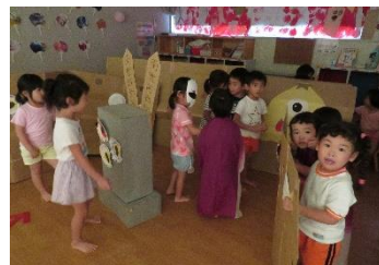
お化け屋敷(3, 4, 5歳児)