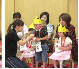
名前と年齢を発表