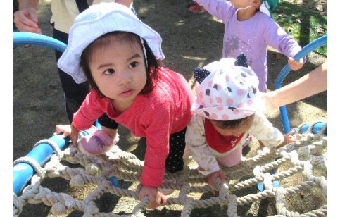
綱登り(手足でバランスよく登って)