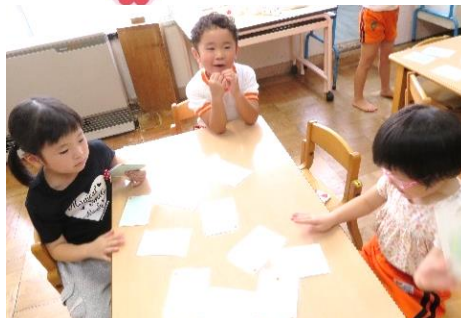
神経衰弱(何枚取れたか教えよう)