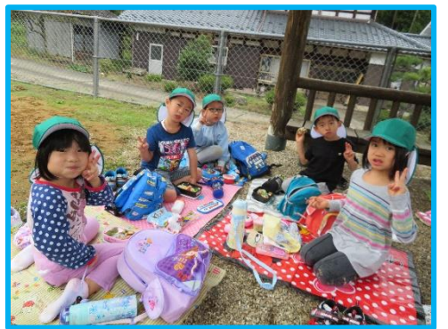
沢山歩いてお腹すいた