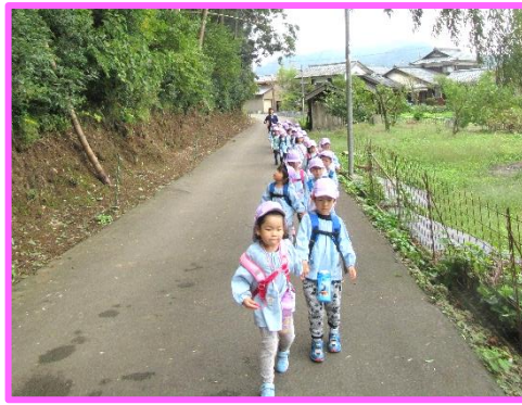
長い距離も頑張って歩くよ