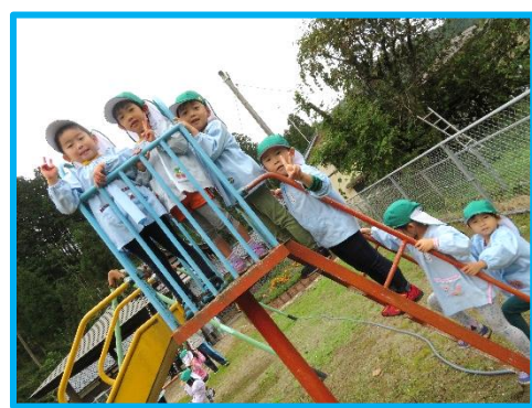
公園のすべり台高いね