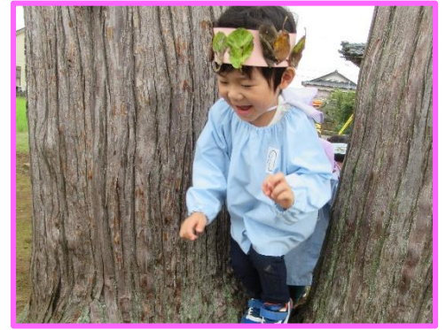
細い隙間をくぐって