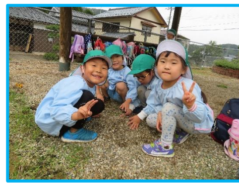
大きさの違う砂利がいっぱい