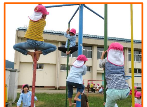
足と腕の力で高く上ろう