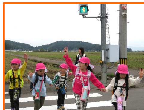
信号の色を確認して安全に渡れるよ