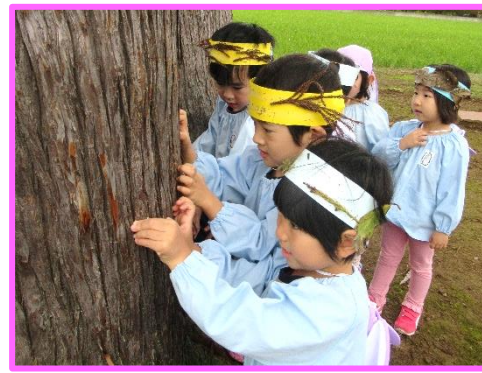
木の表面がザラザラしてるね