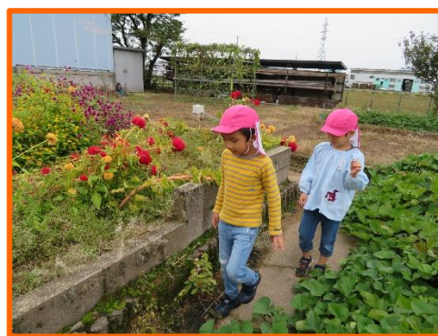
色とりどりのお花きれいだな