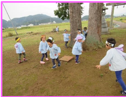
広場で思いきり鬼ごっこ