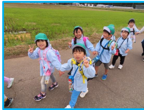
お散歩気持ちいい