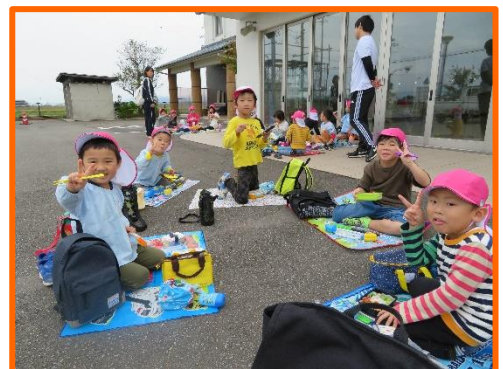
上文殊公民館で食べて遠足気分