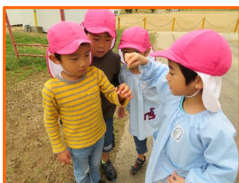
これ何て名前の植物？