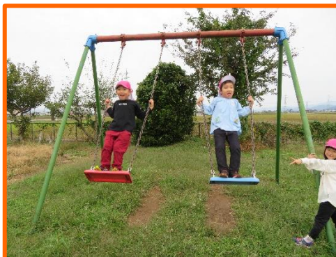
立ちこぎできるよ