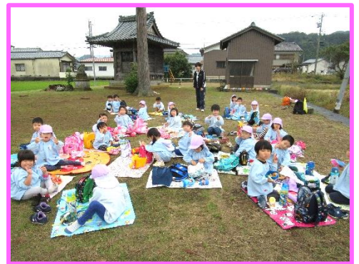
みんなで食べると美味しいね