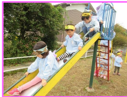
順番を守って滑るよ