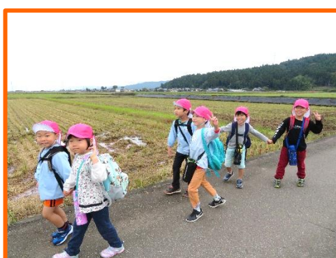
風が気持ちいいね