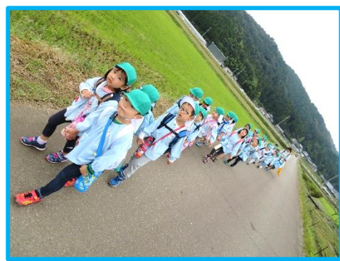
右側通行 交通ルール守ったよ