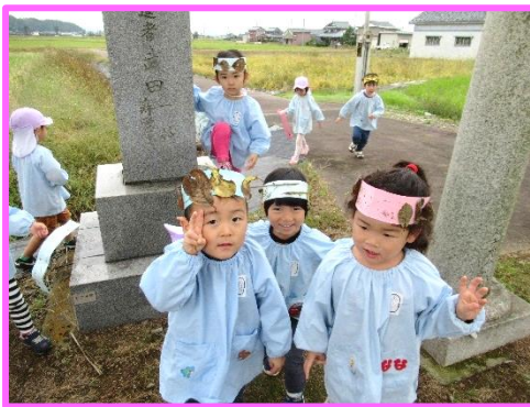
落ち葉でかんむり作ったよ