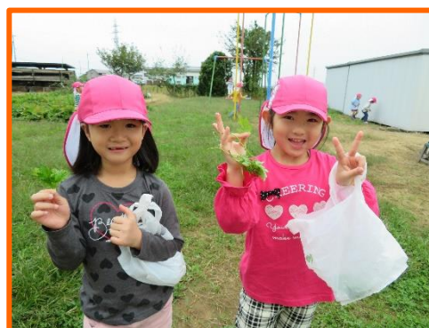
色々な形の葉っぱ見つけたよ