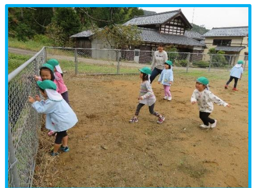
だるまさん転んだルール知ってるよ