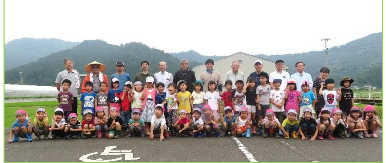
ロータリークラブとすだちの家の方と一緒に記念写真