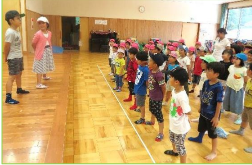
まずは小学校の朝の会♪

卒園児交流のため、一年生 21 名がこども園に来園しました。ひまわり組と一緒に地域のじゃがいも掘りに参加したり、ゲームや DVD 鑑賞を楽しみました。最初は少し恥ずかしがる様子もありましたが、次第に会話も増え、元気な笑い声や掛け声がホールいっぱい響き渡っていました。