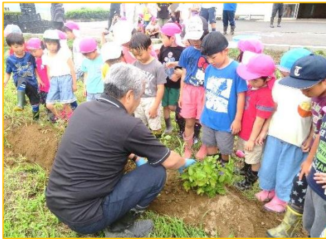
じゃがいもの掘り方を教えてもらいました