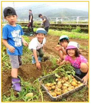
「3月にうえたじゃがいもがこんなに大きくなって」