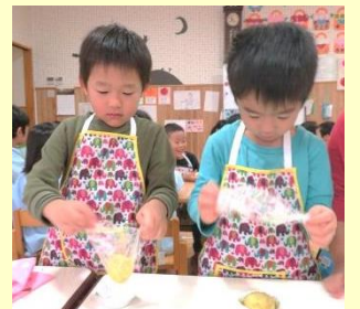
かぼちゃサラダづくり たんぽぽ・さくら・うめ・ひまわり組