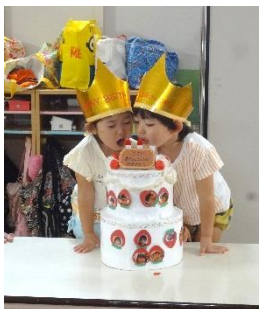
ケーキのプレゼント