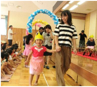
花のトンネルから入場