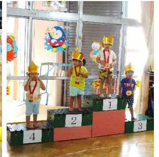
みんな頑張ったね