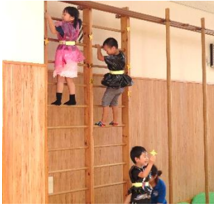
手裏剣取れるかな