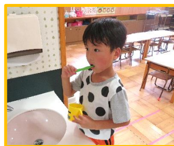
給食後、丁寧に歯磨きをしています