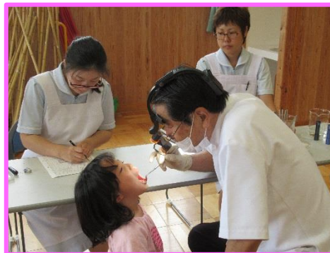
口を大きく開けて