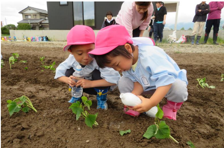
どんな形になるんだろう？