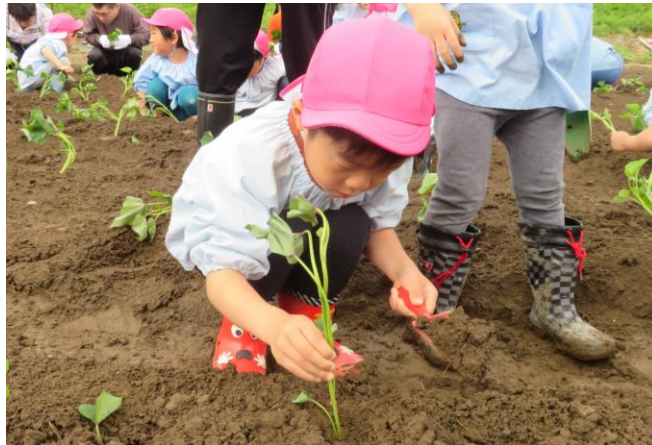
こうやってするのかな？