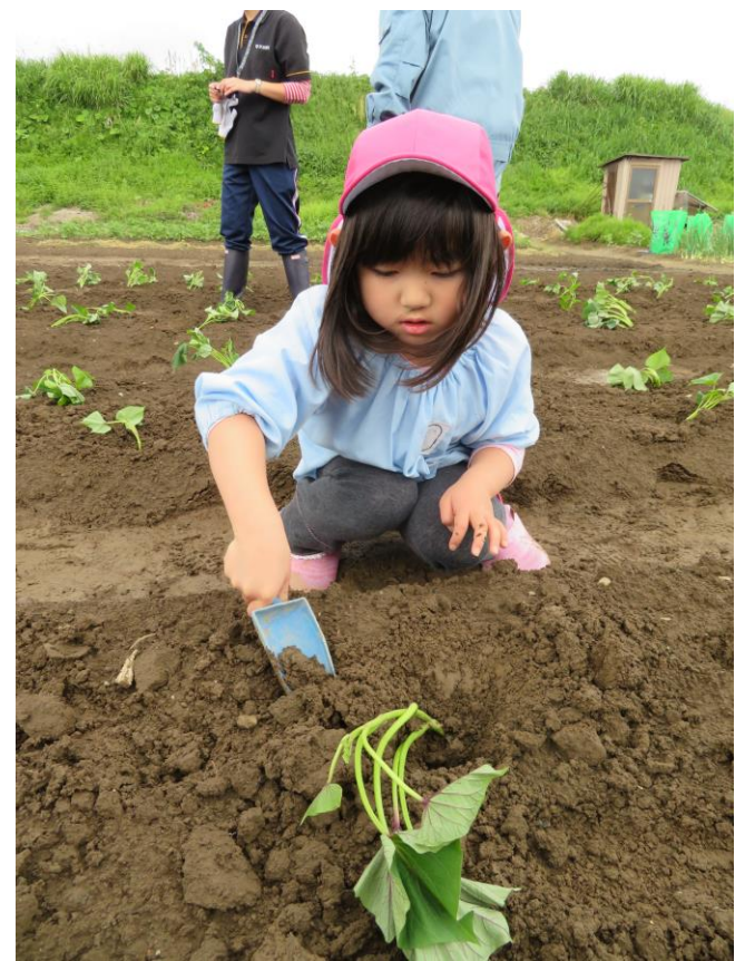
よいしょよいしょ