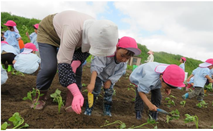
優しく土をかけるよ