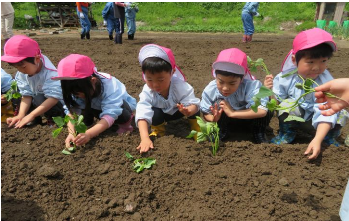
みんな並んで植えたよ