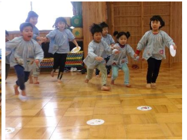
たてわり遊び(カルタとい)