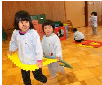
たてわり遊び(電車ごっこ)