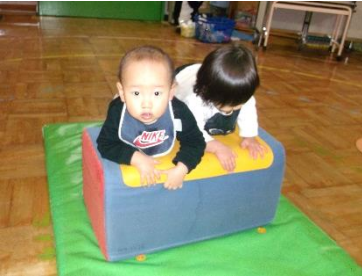
マットによじ登り