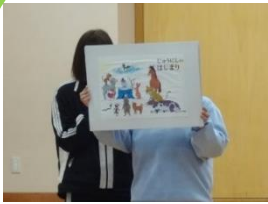
十二支由来の紙芝居