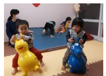
ロティちゃんに、のれたよ