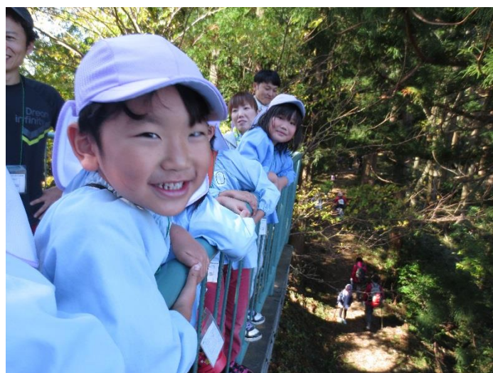
景色を眺めて休憩♪