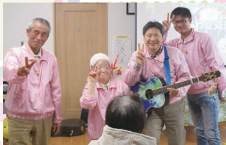
江留上まちづくり協議会(坂井市) わくわくいきいき倶楽部の皆さま

昨年度中はボランティアの方が2度来所され、土曜日の日中活動時にオートハープを使って演奏会を開催しました。演奏会では、知っている曲と一緒に歌い、実際に楽器に触れる機会もありました。演奏会が終わると、ボランティアの方と握手をする方や「ありがとう」と感謝の気持ちを伝える方がいらっしやいました。利用者の方からは「楽しかった」とうれしい感想を聞くことができました。