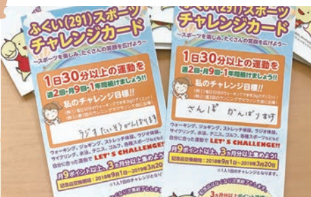
それぞれの目標を書いたチャレンジカード

平成30年に開催された「福井しあわせ元気国体大会」の取り組みでもありました「できることから始めよう体力作り」に利用者の方々に目標を設定して、取り組みました。毎日、活動後にそれぞれのカードに印を押し、頑張りを認め、声かけを行いました。利用者の方からも「頑張ったよ」という声が聞かれ、カードのスタンプが増えると共に、健康に過ごせる日も増えていきました。