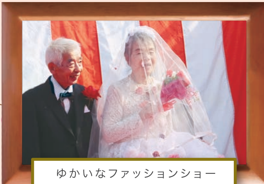
ゆかいなファッションショー

今回の祭りを通し、ふだん、あまり地域の方との交流がない職員や利用者の方でも地域の方々とかかわること、地域とのつながりを実感する機会となりました。