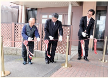
(左から)グループホーム利用者様、福井県健康福祉部企画幹土屋様、高村理事長によるテープカット

改修を進めていたグループホームあすわの工事が完了し、3月19日、落成式が行われました。