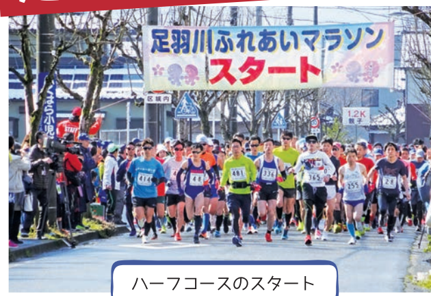
ハーフコースのスタート