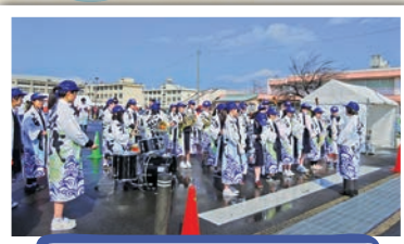
羽水高校吹奏楽部の応援