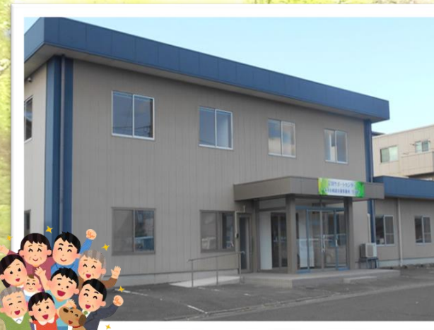
当事業所外観 (足羽サポートセンター併設)