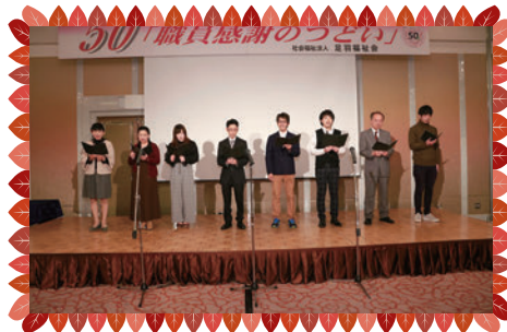
コーラス隊による園歌斉唱