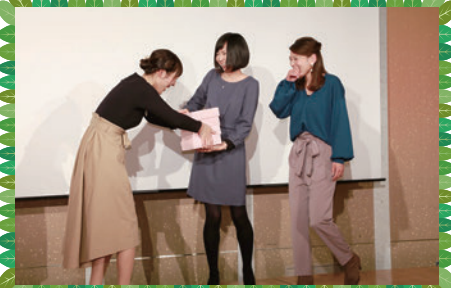
ゲーム(福祉会クイズ) 見事! 全問正解されたチームに 景品贈呈