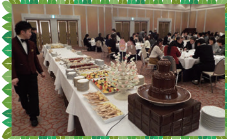
ビュッフェ形式で食事を楽しみました