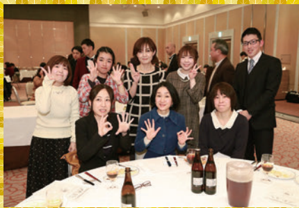
各事業所の職員同士で親睦を深めました★