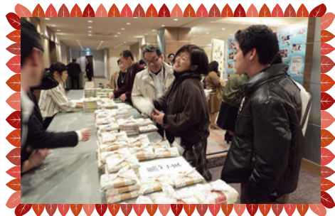
足羽サポートセンターの利用者の方が包んで下さった 羽二重風呂敷をお土産にいただきました♪