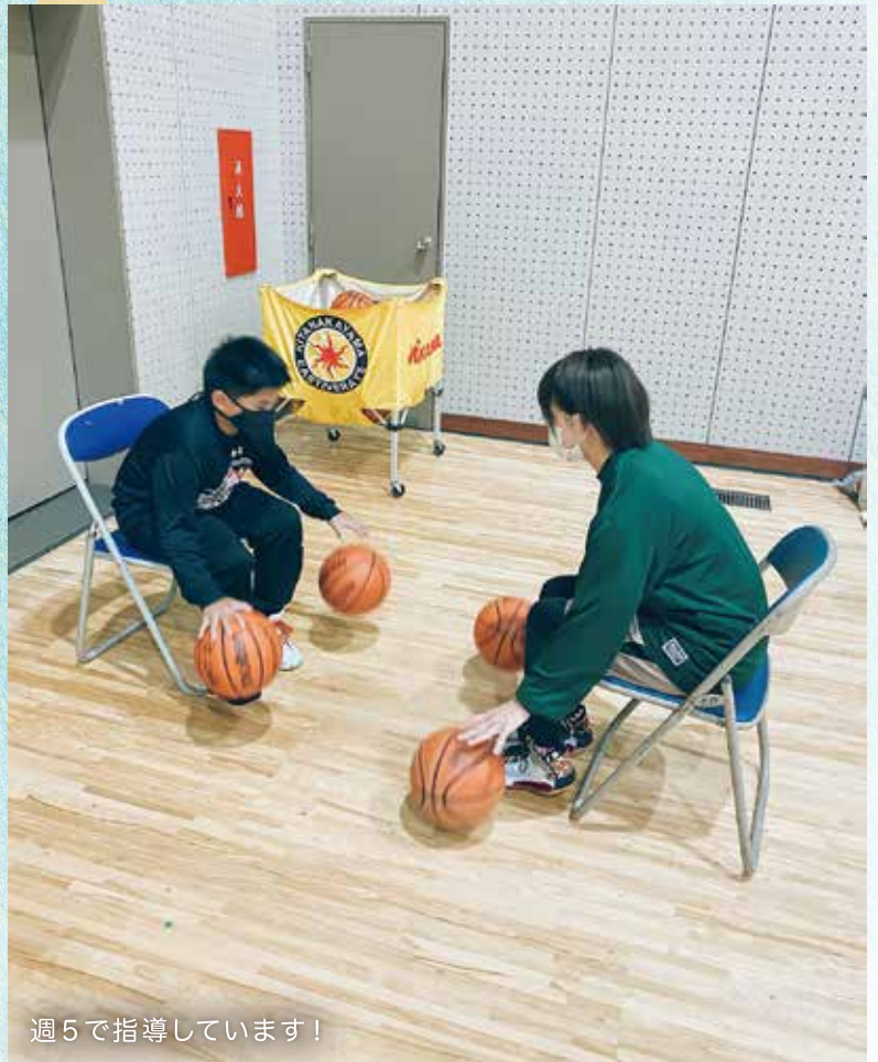
週5で指導しています!

今の段階から運動神経を刺激することで、中学生や高校生になったときにいろいろなスポーツの動きに対して楽