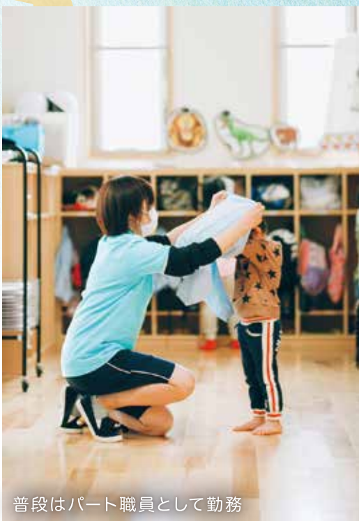
普段はパート職員として勤務

軟に対応できるように なります! だから、今は実感が なくても将来的には「あの時 やってよかった!」ってなっ ていると思うんです。また、動 物がテーマなので、子どもた ちには「これどんな動きやと 思う?」、「これ何に似て る?」など問題形式にする と、みんな楽しそうに取り 組んでいます!