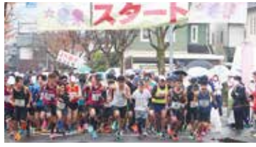
足羽川ふれあいマラソンのスタート地点。多くの人がそれぞれの目標を持って懸命に走ります。あいにくの天候となりましたが、ボランティアの方含め地域の多くの方に支えて頂き、足羽川ふれあいマラソンが実行出来ました。

また、大人数イベントとしながら感染を抑え込むという非常に難しい開催となりましたが、地域の方々はじめボランティアの方々などの多大なご協力やご支援を賜り、改めて御礼申し上げます。