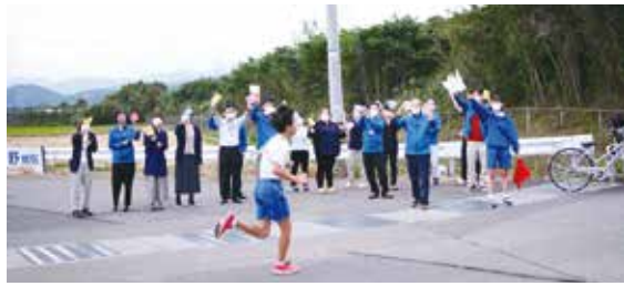
学生を応援する足羽福祉会の職員。応援する側も熱量はランナーと変わりません。コロナ禍によって希薄になった地域との関わりが出来る事を大いに喜んでいます。

全力疾走でたすきをつないでいく中学生の姿に、少なくない刺激をいただき、よりよい地域づくりへ貢献してまいります。