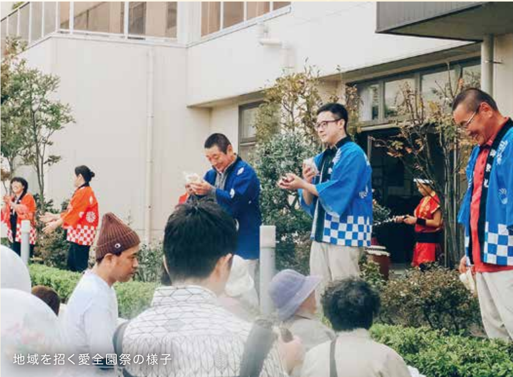
地域を招く愛全園祭の様子

すし、子どもが安らぐ場を提供できれば、地域貢献や施設の広報にもつながります。 このように、地域と関わる意識は自分の中で大切にしています。