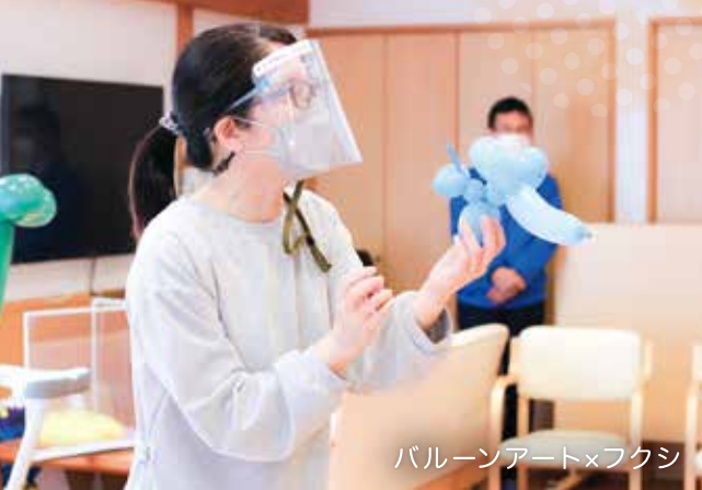
バルーンアート×フクシ

【記事をかいてみて】 差別や偏見がまだまだ社 会課題となっている現代に おいて、私たちのやるべき ことはなんなのかを考えた 時に、それは日常で福祉に 触れる機会をもっと作って いくことであると私は思い ます。福祉をより身近に感 じてもらうことで、最初は 交わらなかつた線と線が私 たちの想像によって結ばれ る。人と社会とをつなぐ架 け橋になっていきたいと、 今回の特集記事を書いて強 く思いました。 法人本部 丹代