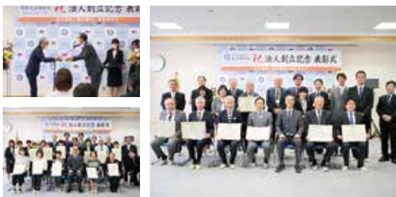
法人創立記念表彰式の様子。法人に尽力し続けていただいている方、様々な形で貢献して頂いている方に表彰状が送られました。

例年、法人創立記念日である10月1日に開催されていきましたが、今年は1日が土曜日となったため、10月3日に開催いたしました。当日の表彰式において、地域の方への感謝状授与、永年勤続表彰、職員特別功績表彰を行いました。まだ予定を許さない新型コロナウイルスの感染対策として、今年度も午前部の部と午後部のに分け、笑顔が多い和やかな雰囲気で行われました。