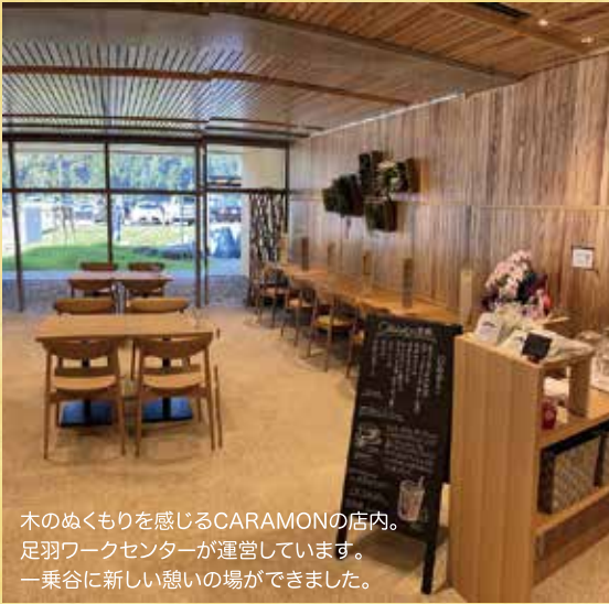
木のぬくもりを感じるCARAMONの店内。 足羽ワークセンターが運営しています。 一乗谷に新しい憩いの場ができました。

ここでは食べられない特別なメニューも多数ございますので、是非一度足をお運びいただき、CARAMONでくつろぎながら、かつての朝倉氏の栄華に思いを馳せてみてはいかがでしょうか。