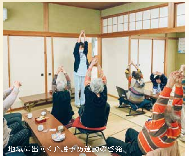
地域に出向く介護予防運動の啓発

今回の取材テーマがカケルフクシということで、私は地域交流を通じて「福祉の仕事＝支援ではない」ということを皆さんに知ってほしいです。地域支援の取り組みが再開できていない現状ではありますが、地域と関わることは職員にとっても地域にとっても福祉への視野を広げきっかけになると思います。これからも、そういった福祉マインドを後輩に伝えていきたいです。