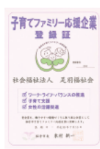
子育てファミリー 応援企業