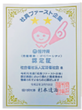
社員ファースト企業