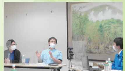
令和3年度4月開催説明会 座談会の様子