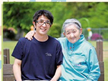
かわいい息子のよう