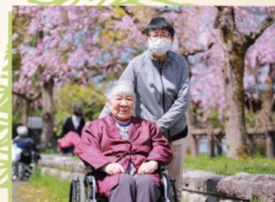
ポカポカ陽気のお花見