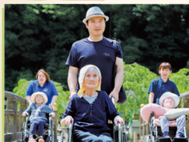
朝倉氏遺跡へお出かけ