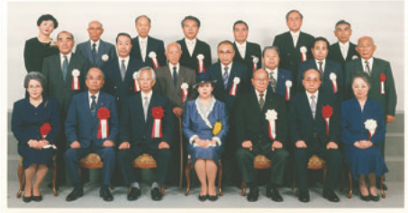
創立25周年記念(平成4年6月9日) 三笠宮妃殿下(前列中央)、高木総裁(前列右端)