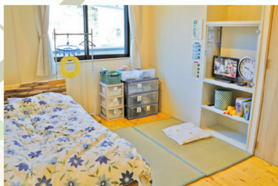
あたらしいお部屋！