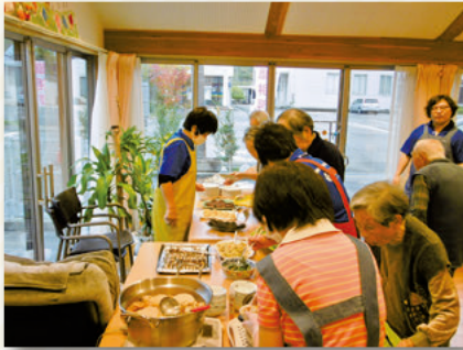
おはぎバイキング