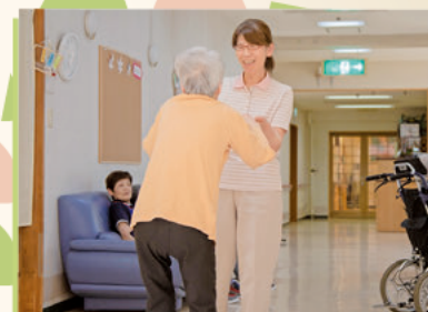
その調子でゆっくりと