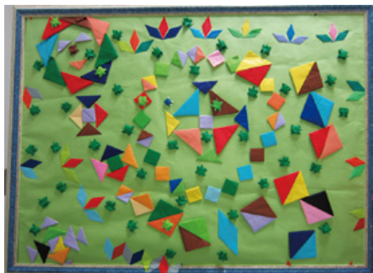
「創造～そうぞう」をテーマにした「ひまわり」