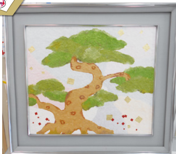
受賞したちぎり絵クラブのテーマ「能楽の松」