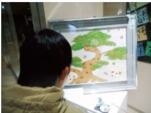
展示された作品を見学に行きました!