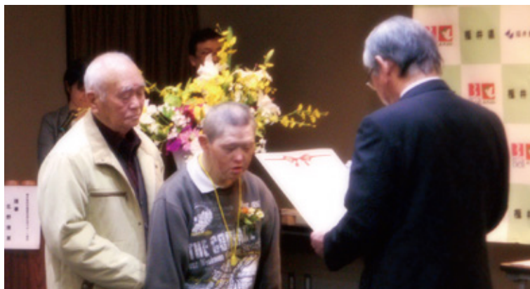
アール・ブリュット展ふくいでの表彰の様子 2016年書道の部で 大賞受賞!