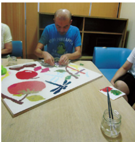
ちぎり絵クラブの活動中!

クラブ活動中は講師の先生と共に作品作りをしています。利用者の方は早く作品を仕上げたくて一生懸命集中しています。