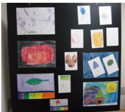
テーマ「秋の収穫祭」

これからも「思いっきり描こう」をモットーに利用者の方に楽しく取り組んでいただけるよう画材等の準備をしていきます。