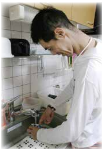
家事をしている様子(兄)

職員が利用者の方の生活を決めるのではなく、本人が希望する暮らしを実現できるようにするにはどのような支