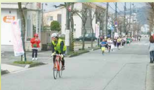
日本競輪選手会福井支部 競輪選手による先導