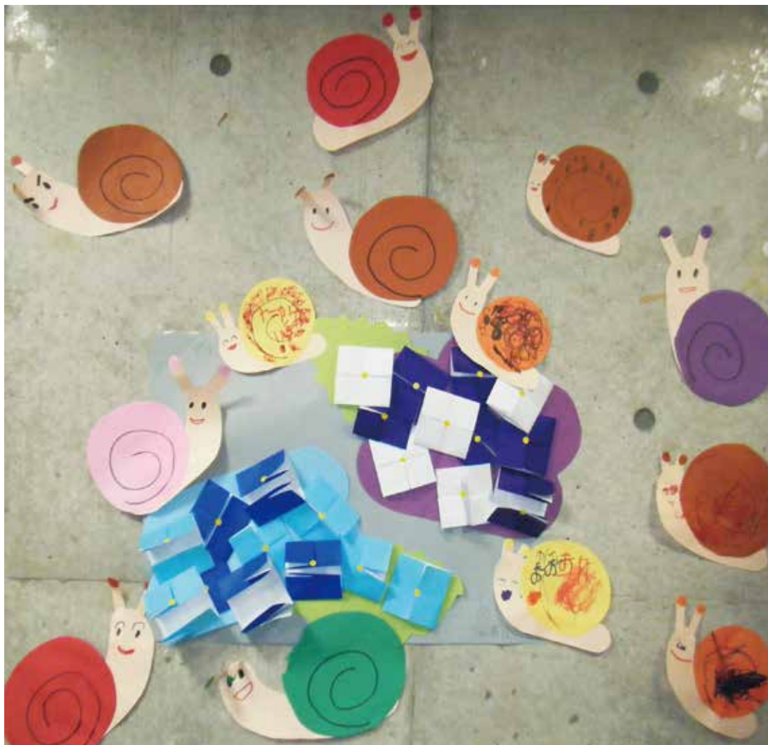
装飾活動で作った装飾