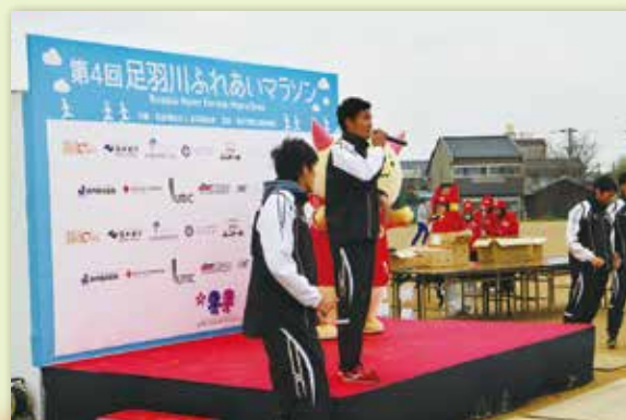
ユティック陸上競技部のワンポイントレッスン