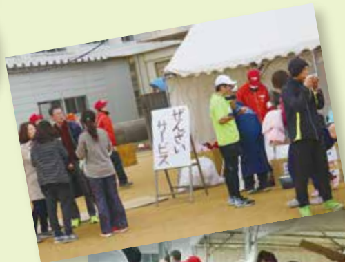
恒例のぜんざいサービス