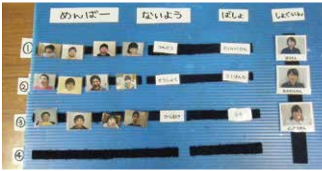
グループ分けボードを見て、それぞれの活動へ移動

利用者の方はグループ分けボードを見て、自分が今日どんな活動をするか確認します。1グループ4〜6人で構成されており、①未就学〜小学生②中学生③高校生と3グループ編成になっています。活動時間は30分〜1時間です。