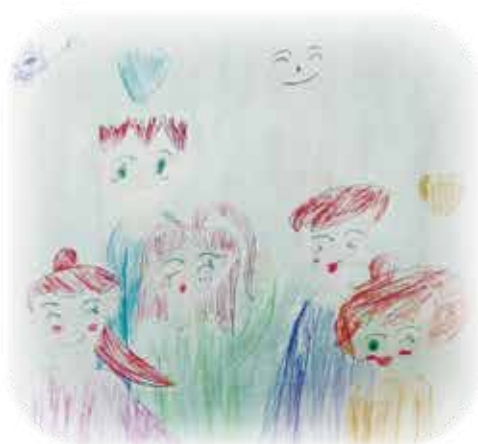
地域の子どものイラスト