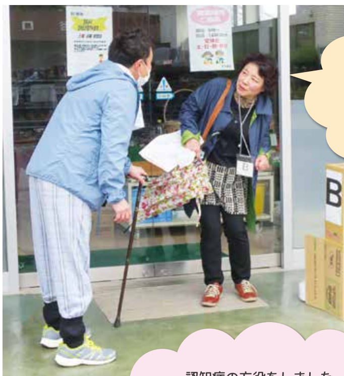
ちくちくことばより ふわふわことばで...

声かけ役を体験しました。 3つの「ない」と7つのポイントに 気をつけて声かけしました。 その人の気持ちになって接することが 大事だと思いました。