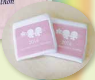
参加賞は一般がTシャツ 親子はペアのリストバンド