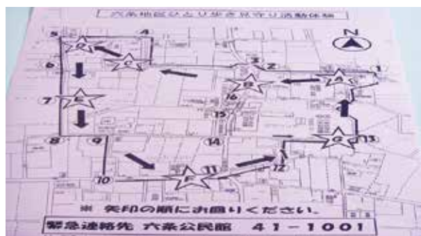
やじるしを目安に体験しました