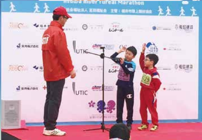
兄弟による選手宣誓 (弟さんが誕生日)

平成28年3月20日、 今回で第4回となった足羽川ふれあいマラソンは、 おかげさまで無事に終えることができました。 地域の皆様、協賛各社、多くのボランティアの皆様の ご支援・ご協力に感謝いたします。