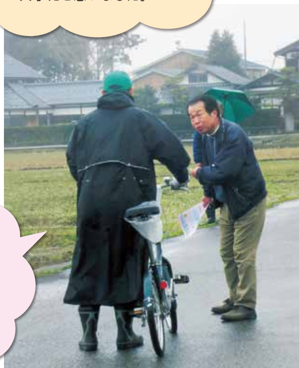
顔を見てゆっくりと...おだやかに

認知症の方役をしました。 後ろから声をかけられたり、 肩に触られると怖かったです。 方言で話してくれると安心できました。 何よりも「さりげなく自然に」が 一番と実感しました。