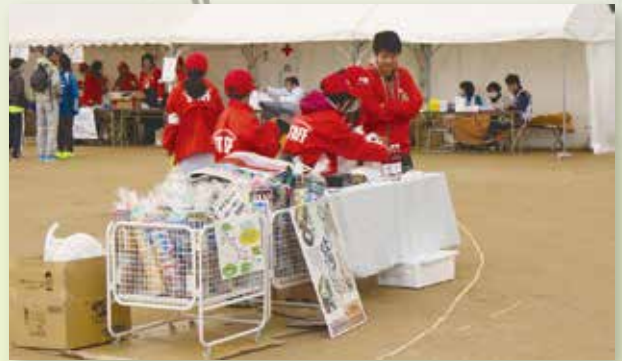
利用者の方が製作したマットや特産品・マラソングッズの販売