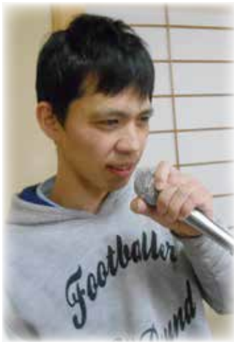
温泉でカラオケ(弟)

転車に乗って出かけたり、部屋でテレビやゲームをしたりと好きな過ごし方を選択できるから楽しいと満足されている声が聞かれました。また、他の利用者の方と一緒に外食されたり、泊で温泉に行かれたりと楽しまれ