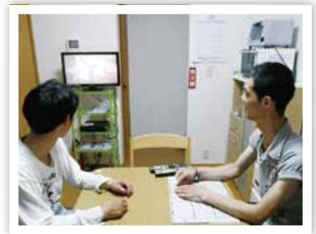
兄弟でTVを見て過ごす