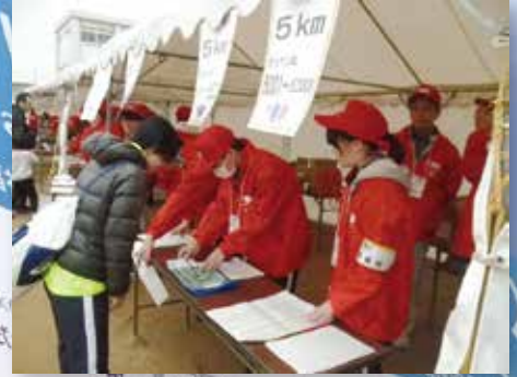
ボランティアスタッフによるランナー受付