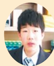
勉強、遊び 頑張ります。