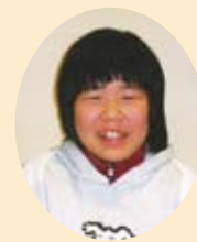
いっぱいお手伝い したい!