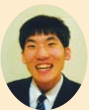
お仕事 がんばります。