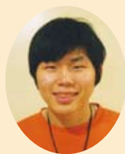
調理の仕事が したいです。