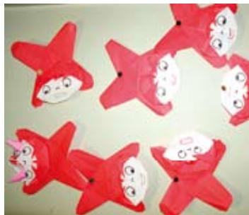
いろいろな表情があるよ♪

折り紙クラブの出展作品といえば、折りづる、花かごとといったものが多かったですが、ときには、アイデアを凝らして話題のキャラクターにも挑戦しています。